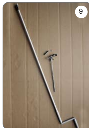
Korba, przegub Cardana 45° lub 90° z zaczepem dzwinkowym [9].