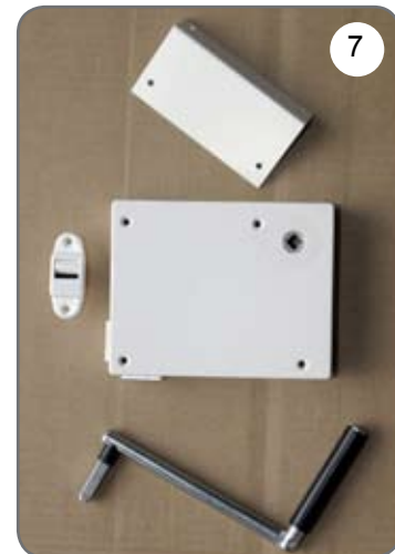
Kaseta z przekładnią na taśmę (pasek), płytka do mocowania kasety, prowadnica taśmy (paska), korba [7].