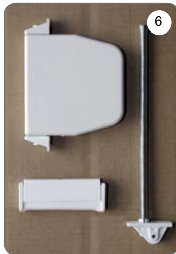
Zwijacz na linkę, prowadnica linki, uchwyt linki [6].