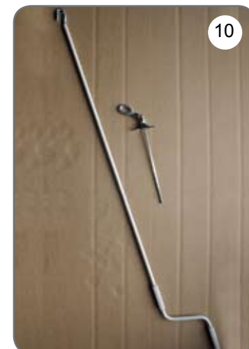
Korba, przegub Cardana 45° lub 90° z uchem [10].