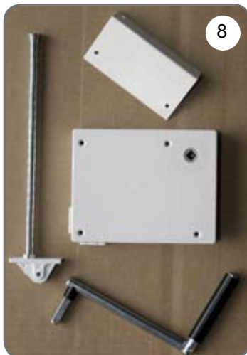
Kaseta z przekładnią na linkę, płytka do mocowania kasety, prowadnica linki, korba [8].