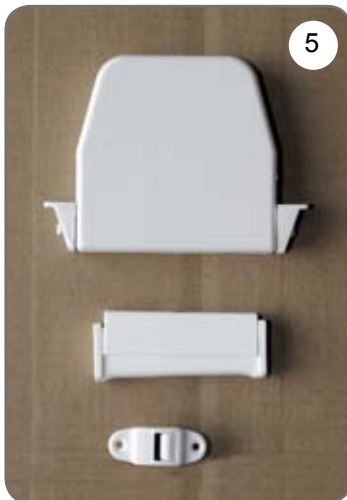
Zwijacz na taśmę (pasek), prowadnica taśmy (paska), uchwyt taśmy (paska) [5].

b) Rodzaje stosowanych napędów ręcznych (opcje):